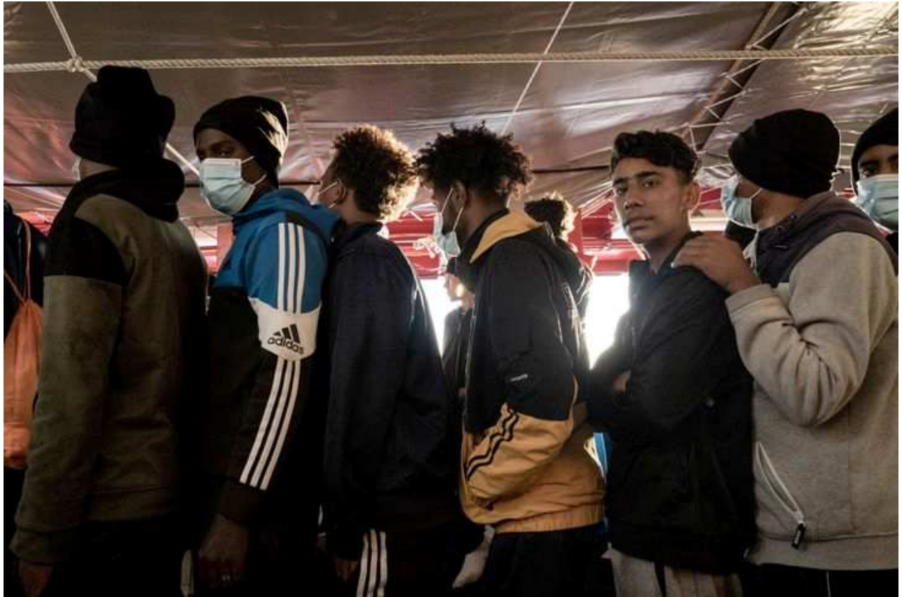
Des migrants débarquant à Toulon depuis le bateau Ocean Viking , le 11 novembre 2022.